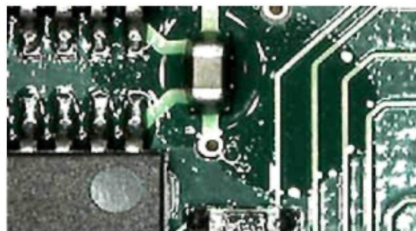
Смачиваемость масла на печатной плате без защитного покрытия

Тест на несмачиваемость масла также может помочь идентифицировать наличие покрытия Novec™ 1700 на печатной плате. Высохшие пленки этого покрытия отталкивают жидкости, такие как минеральное масло, парафиновое масло и гексадекан. Несмачиваемость минерального масла или парафинового масла на областях, покрытых пленкой Novec™ 1700, является простым методом проверки покрытия в процессе приемочного контроля (см. рис. 3).