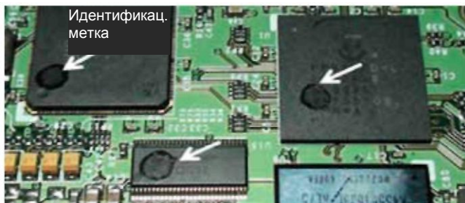
Рис. 1. Примеры маркировки темных компонентов каплями покрытия Novec™ 1700 для идентификации узлов с уже нанесенным покрытием

Для того чтобы идентифицировать печатную плату с нанесенным покрытием, на черную поверхность смонтированных компонентов можно нанести небольшие точечные пятна покровного раствора (см. рис. 1). Метки раствора Novec™ 1700 на темной поверхности видны невооруженным глазом.